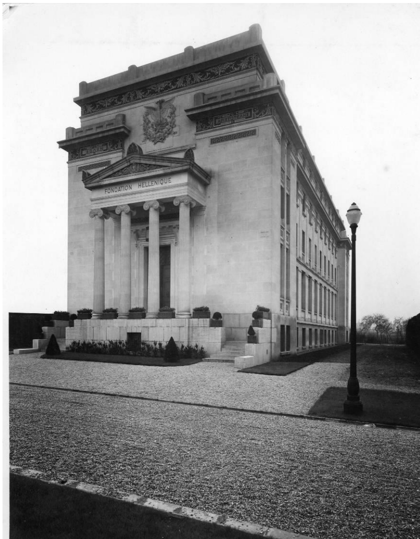
Αποψη του Ελληνικού Ιδρύματος στο πάρκο της Πανεπιστημιούπολης , αρχιτέκτονας Νικόλαος Ζάχος.

Η ιδιαιτερότητα του κτηρίου συνοψίζεται εξάλλου στη χρήση νεοκλασικών στοιχείων ανάμεικτων με γεωμετρικά μοτίβα Art Deco.