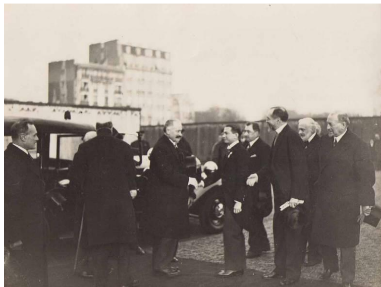
Ο Πρόεδρος της Γαλλικής Δημοκρατίας, A. Lebrun, στα εγκαίνια της Fondation Hellénique. Τον υποδέχεται ο διευθυντής του Ιδρύματος, Διονύσιος Ζακυθηνός. Στα δεξιά του, ο ιδρυτής της Διεθνούς Πανεπιστημιούπολης, André Honnorat

Στις 23 Δεκεμβρίου 1932 γίνονται πανηγυρικά τα εγκαίνια του Ελληνικού Ιδρύματος στη Διεθνή Πανεπιστημιούπολη στο Παρίσι.