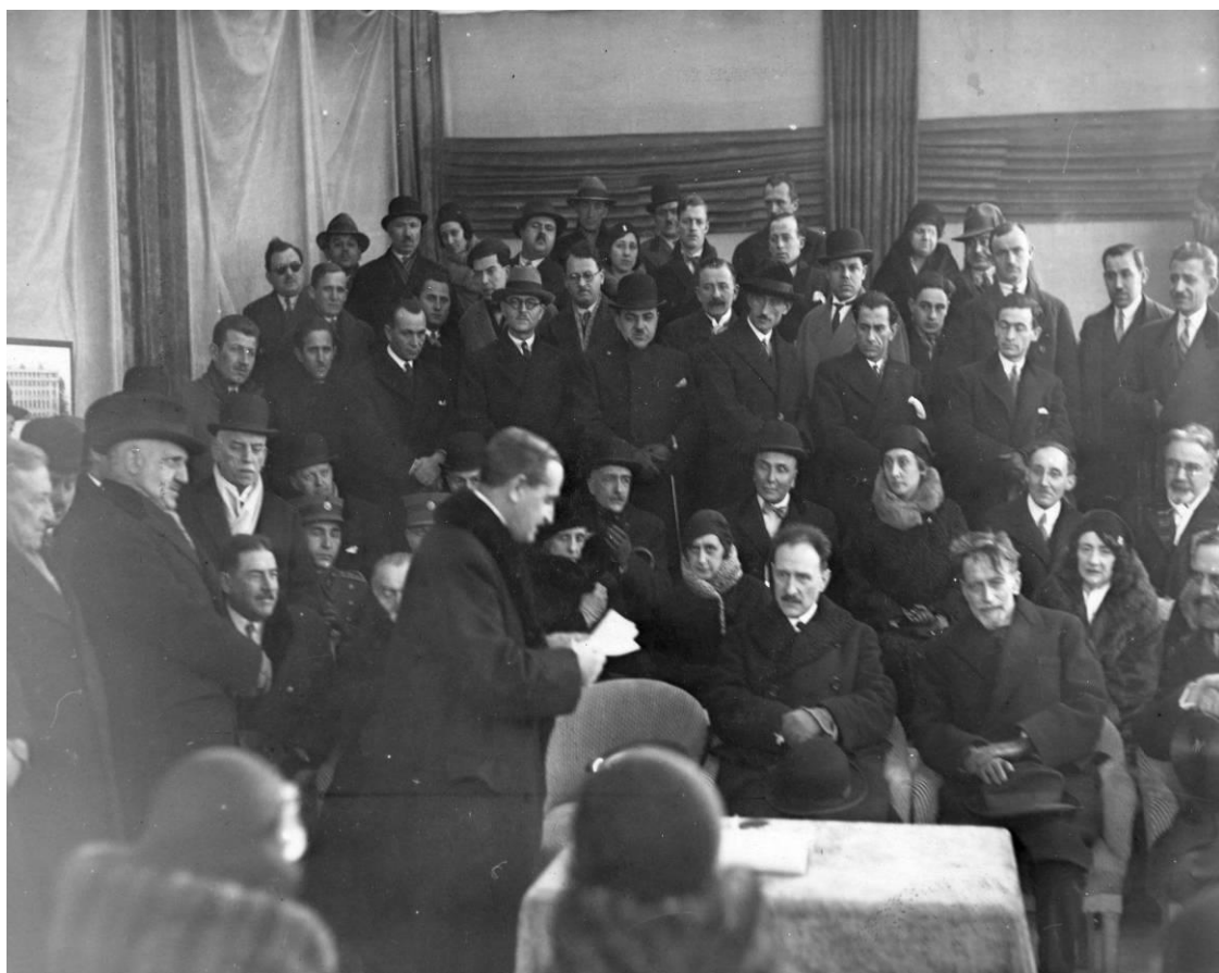
Ομιλία του Νικόλαου Πολίτη, την ημέρα της τοποθέτησης του θεμέλιου λίθου του Ελληνικού Ιδρύματος, 14 Ιανουαρίου 1931. Στην πρώτη σειρά διακρίνονται ο Πρωθυπουργός της Γαλλίας Camille Chautemps και ο Πρύτανης του Πανεπιστημίου Sébastien Charléty

Διαπρεπής διεθνολόγος, καθηγητής των Πανεπιστημίων της Αιξ, του Πουατιέ και του Παρισιού, ένθερμος θαυμαστής του αρχαίου ελληνικού πολιτισμού, αναθρεμμένος μέσα στο κοσμοπολίτικο περιβάλλον των Ιόνιων νήσων, προσωπικότητα αναγνωρισμένη και με κύρος στους διεθνείς κύκλους, γαλλόφιλος, ο Νικόλαος Πολίτης ήξερε περισσότερο από τον καθένα τον τρόπο να προωθήσει την προσπάθεια ανέγερσης του ελληνικού σπιτιού, ασκώντας πίεση στους διεθνείς ελληνικούς κύκλους και συνεργαζόμενος με τις πανεπιστημιακές κοινότητες των δύο χωρών.