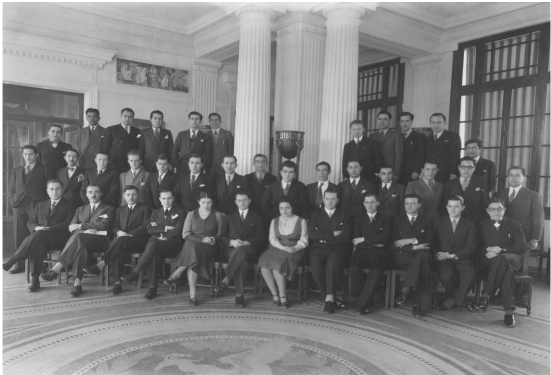
Αναμνηστική φωτογραφία των ενοίκων του Ελληνικού Ιδρύματος στο σαλόνι (1932).

Χάρη στην σοφή διοίκηση του αείμνηστου Κωνσταντίνου Γεωργούλη, διευθυντή του Ιδρύματος για περισσότερα από 40 χρόνια (1963 - 2004), πολλά από τα οποία υπήρξαν ιδιαίτερα δύσκολα, το Ελληνικό Ίδρυμα διέσχισε το δεύτερο ήμισυ του 20ου αιώνα εκπληρώνοντας με συνέπεια και σεβασμό το έργο που του είχαν εμπιστευθεί οι ιδρυτές του.