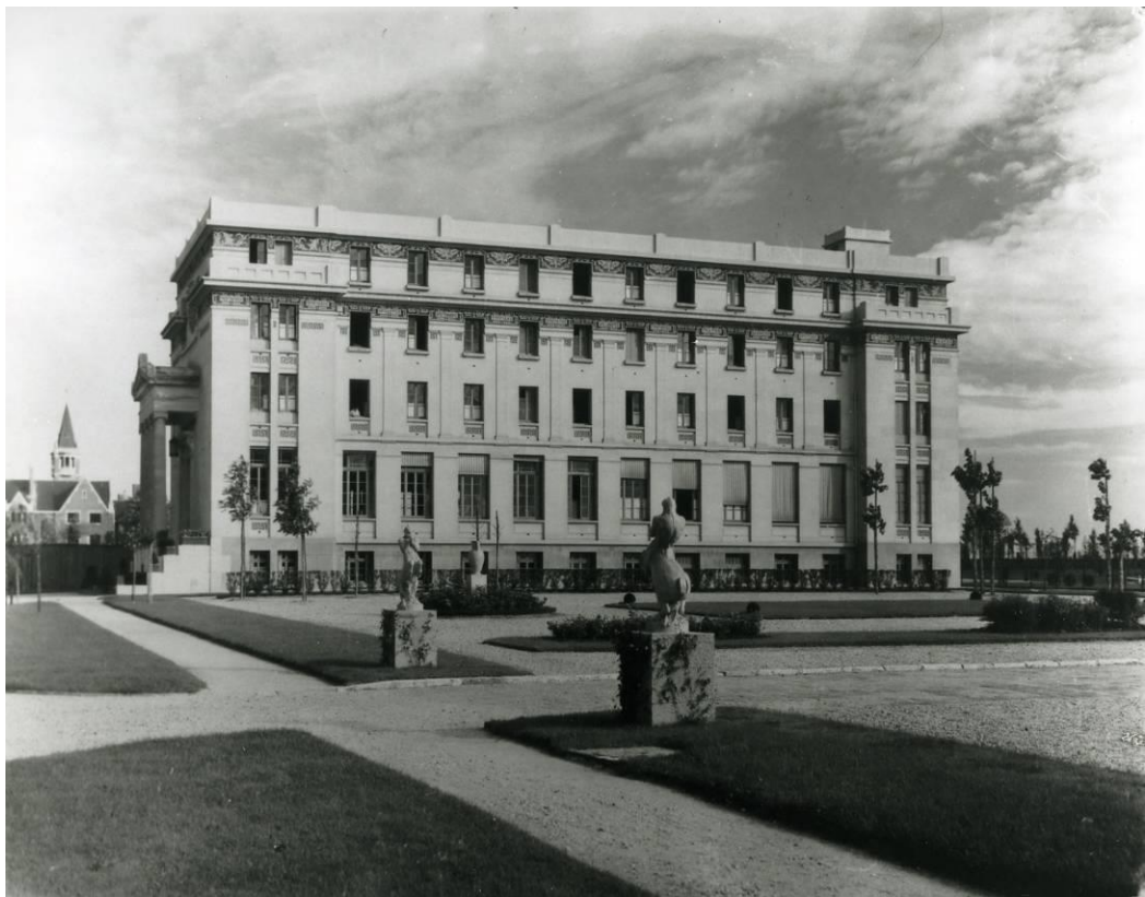
Αποψη του Ελληνικού Ιδρύματος στο πάρκο της Πανεπιστημιούπολης , αρχιτέκτονας Νικόλαος Ζάχος

Αναμφισβήτητα όμως το σημαντικότερο έργο του Ζάχου υπήρξε η μελέτη και επίβλεψη του κτηρίου του Ελληνικού Ιδρύματος στη Διεθνή Πανεπιστημιούπολη του Παρισιού, ένα έργο γοήτρου που κτίστηκε σε δύο μόλις χρόνια (1930-1932).