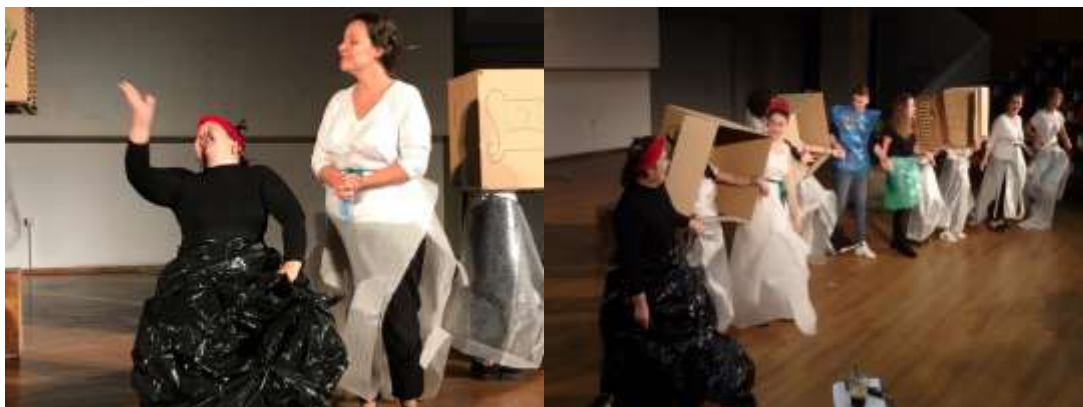
16/1/2019: Παρουσιάσεις στο πλαίσιο του μαθήματος «Ιστορία ευρωπαϊκού θεάτρου Α΄» στην Αίθια της Φιλοσοφικής [διδάσκων: Ιωσήφ Βιβιλιάκης].