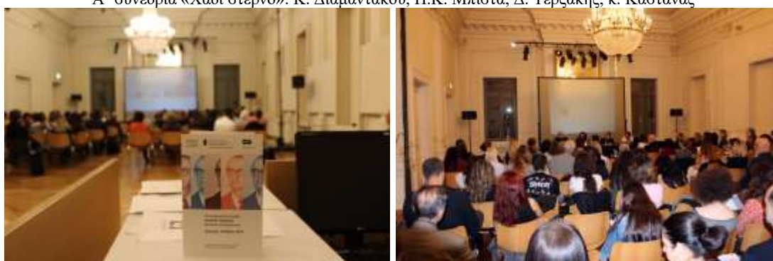
Στιγμιότυπα από την Ημερίδα για τον Άγγελο Τερζάκη