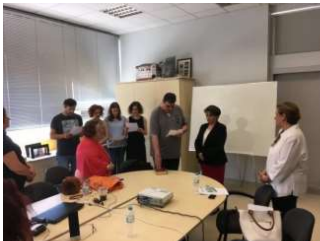
Τελετή ορκωμοσίας μεταπτυχιακών αποφοίτων, 7 Ιουνίου 2018