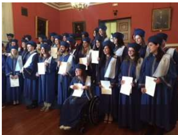
Τελετή ορκωμοσίας πτυχιούχων, 18 Απριλίου 2018