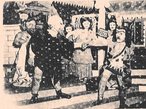
Αριστοφάνης, Νεφέλες , Εθνικό θέατρο, 1951

Σκηνοθεσίες του Σωκράτη Καραντινού στο επαγγελματικό θέατρο: